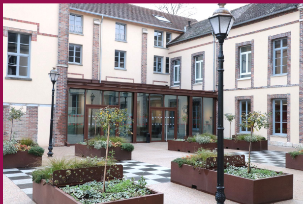
"Espaces Culturels Savinien"